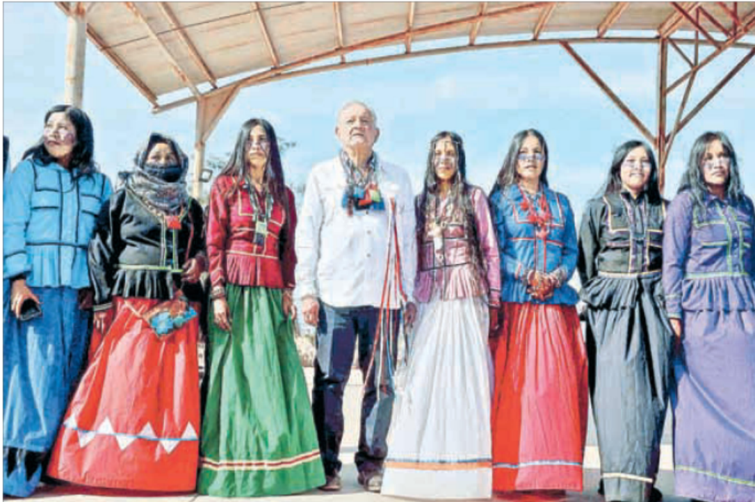
▲ En el diamante del estadio Héctor Espino, en Hermosillo, Sonora, el presidente Andrés Manuel López Obrador habló de lo que espera en los próximos tres años: "dependiendo de lo que diga la naturaleza o el Creador, pero sobre todo lo que diga el pueblo, pienso que terminaré mi mandato hasta septiembre de 2024". Más tarde, visitó Punta