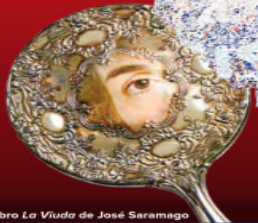
Foto: Tomada de libro La Viuda de José Saramago

Previo al centenario de Saramago, La viuda , su novela publicada en portugués en 1947, se edita por primera vez en español. / 22