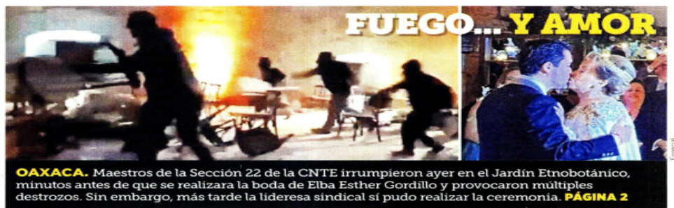
OAXACA. Maestros de la Sección 22 de la CNTE irrumpieron ayer en el Jardín Etnobotánico, minutos antes de que se realizara la boda de Elba Esther Gordillo y provocaron múltiples destrozos. Sin embargo, más tarde la lideresa sindical sí pudo realizar la ceremonia. PÁGINA 2