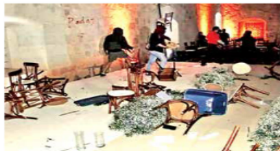
Los integrantes del magisterio disidente destruyeron mesas, sillas y adornos en el Jardín Etnobotánico.