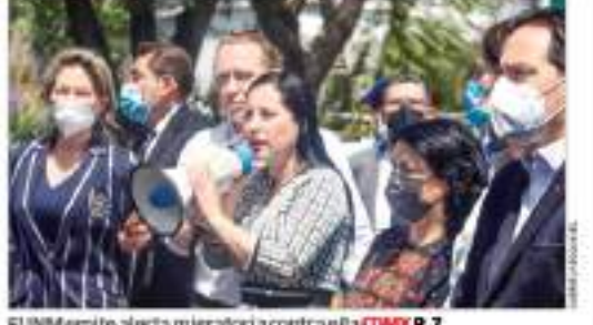
El INM emite alerta migratoria contra el CDMX P. 7

VINCULAN A PROCESO A CUEVAS: "ME SIENTO TRANQUILA", AFIRMA