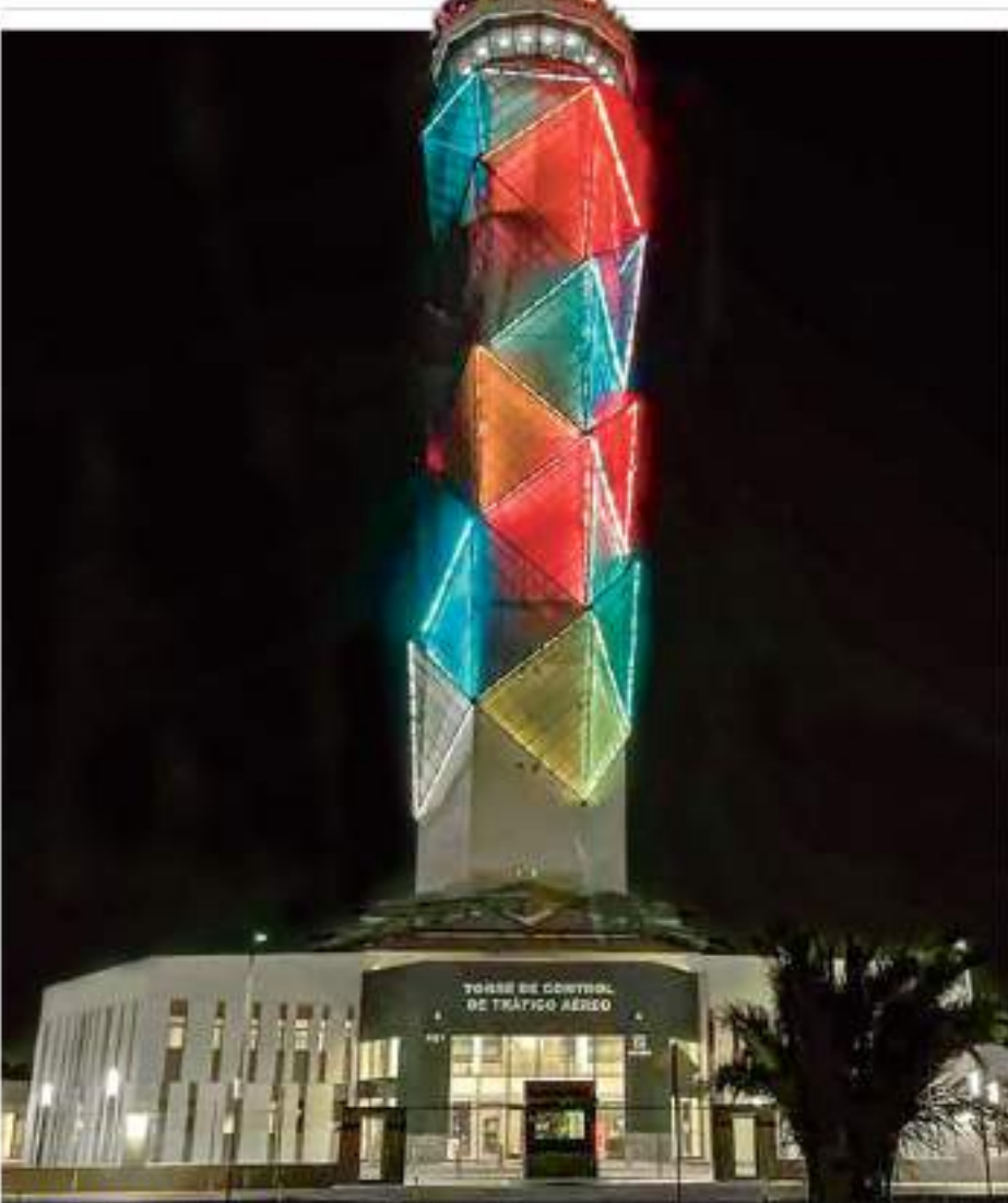
EL ASFALTO TOMA COLOR. Esta semana se han realizado vuelos de familiarización con apoyo de la Torre de Control, a cargo del Seneam. Autoridades prometen que se compensará traslado con menor tiempo para abordar MÉXICO P. 3

En 90% de los casos en que los hijos son utilizados para lastimar a la madre, los agresores cuentan con formas de bloquear la justicia, ya sea a través de dinero o contactos con alguna autoridad. "De un día para otro dejamos de ver a nuestros hijos, te matan en vida", comenta una madre afectada por esta modalidad de violencia de género, que ha comenzado a ser abordada en algunas iniciativas legislativas en México, y que ha costado, incluso, la vida de algún menor MÉXICO P. 4