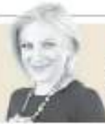
Susana Moscatel "El increíble periplo de Zelenski de la comedia a la política" - P. 20