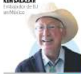
KENSALAZAR Embajador de EU en México

BANQUEROS. Indefinición en el sector eléctrico, lastre para el capital privado en energía y el crecimiento económico