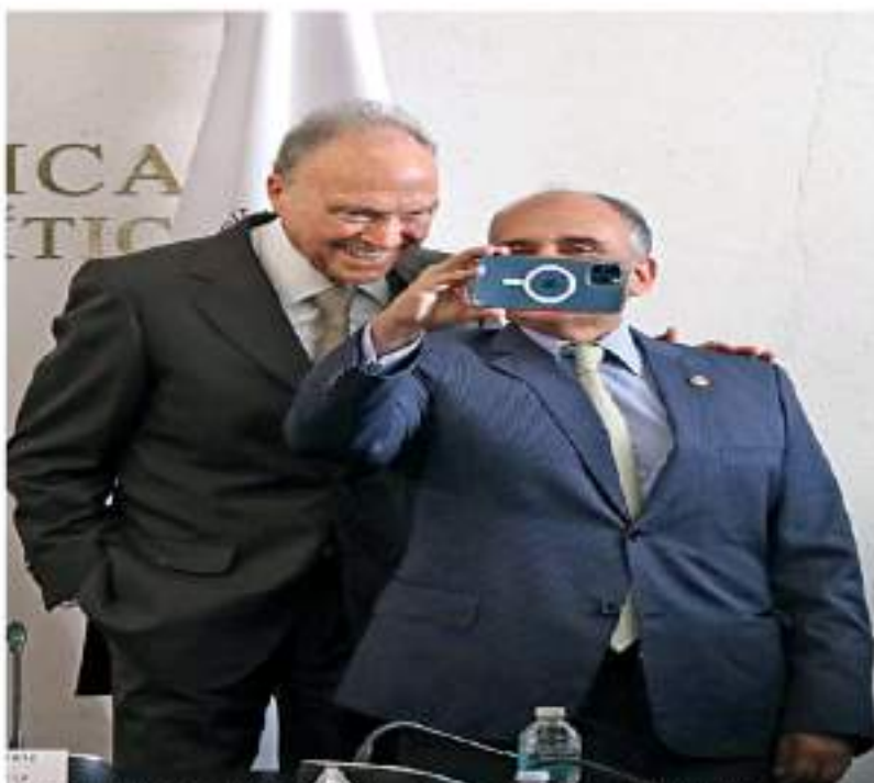
El fiscal general de la República, Alejandro Gertz Mansero, y el senador priista Manuel Afreese en un momento de su sesión durante la reconstrucción a puerta cerrada ante legisladores.