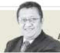
Alfredo Campos "Palestina: choque por la sucesión de Abu Mazen" - P. 3

Narco. Embarcaciones de Colombia, Guatemala y Ecuador viajan a 100 km/h y recargan combustible en falsos buques pesqueros distribuidos en la ruta a EU; en febrero se decomisó casi lo mismo que en 2021