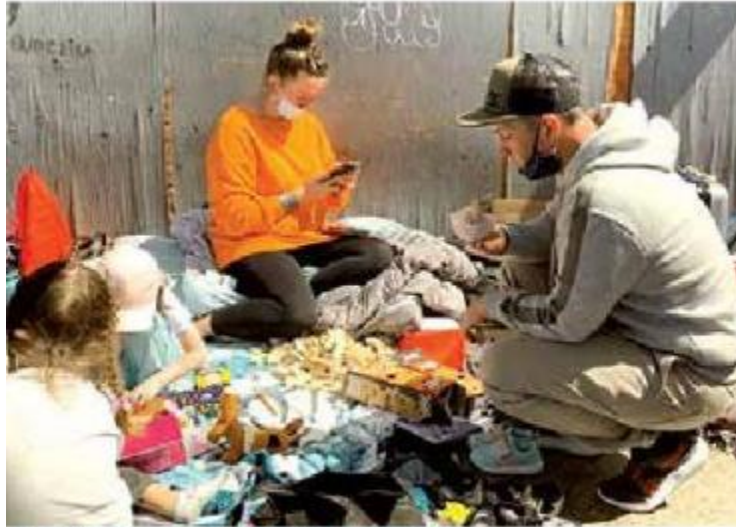
TIJUANA, BAJA CALIFORNIA

Tijuana. - “Se las voy a dejar por si alguien quiere, porque ya me voy, ¿les puedes decir? ya me voy, dile que los guarden para que al rato si tienen hambre. Bye”.