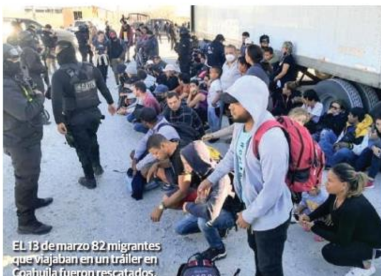
EL 13 de marzo 82 migrantes que viajaban en un tráiler en Coahuila fueron rescatados.