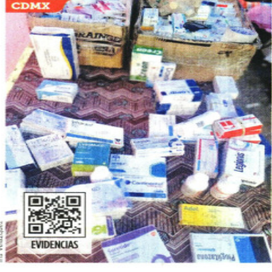
CDMX. IRIS VELÁZQUEZ

En recorridos por tianguis de tres ciudades del País se detectó la venta, de manera abierta, de los medicamentos controlados.