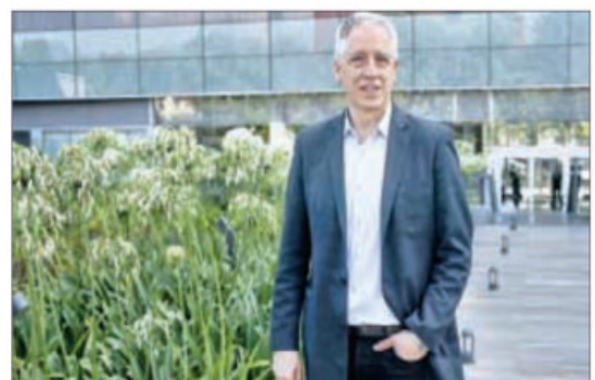
▲ El también ex vicepresidente de Bolivia, ayer en la Ciudad de México.