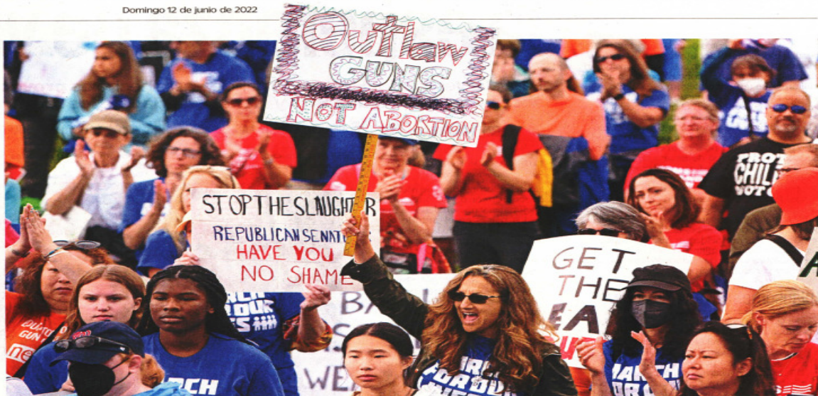
Manifestantes de todas las edades protestaron en el National Mall, en Washington, contra la violencia armada en Estados Unidos.