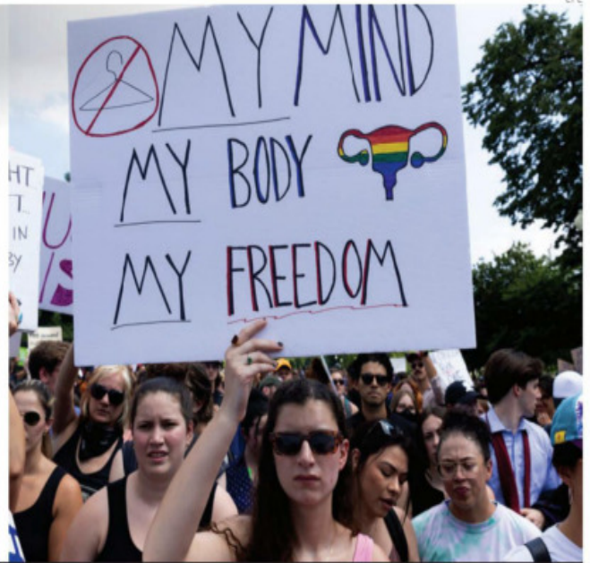
Activistas en pro y en contra del aborto se manifestaron por todo Estados Unidos por el fallo de los cinco jueces y una jueza que derogaron ese derecho federal.