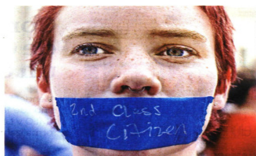
Con una cinta en la boca, una mujer proaborto protestó en Washington por la decisión de la Corte Suprema de poner fin a este derecho.