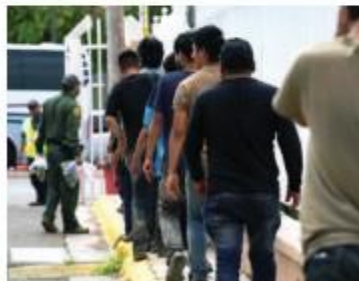
Son formados en largas filas de camino a México.

Esposados de pies y manos, los migrantes que piden asilo a Estados Unidos son regresados a esperar en México su respuesta, aunque en el traslado sean víctimas de malos tratos o violaciones de derechos humanos.