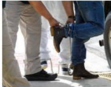
Retiro de grilletes previo a su devolución hacia la frontera mexicana.