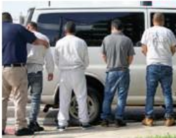
Indocumentados sujetos a deportación, con esposas en los pies.