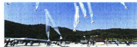
En los últimos años, desde Corea del Sur se han enviado globos a través de la frontera con Norcorea con panfletos contra el líder Kim Jong-un.

Norcorea no culpó directamente de la propagación al Sur, pero su Sede Estatal de Prevención de Epidemias advirtió a la población que "trate con cuidado las cosas extrañas" que llegan al país a través de "globos", el viento u "otro fenómeno climático".