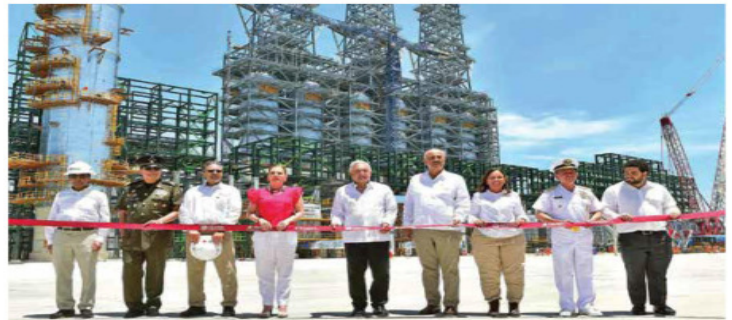
Acompañado por su esposa, Beatriz Gutiérrez Müller, y funcionarios federales, el presidente López Obrador inauguró la primera etapa de la Refinería Olmeca, cuya meta de producción es de 340 mil barriles diarios.

Acompañado por su esposa, Beatriz Gutiérrez Müller, integrantes de su gabinete, gobernadores y empresarios, detalló que para alcanzar la meta de autosuficiencia, las