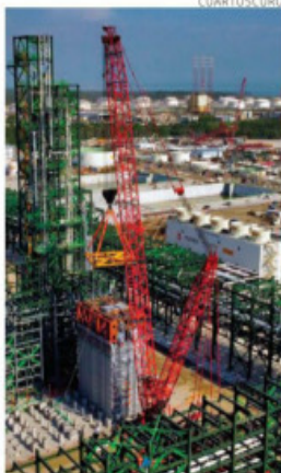
Vista de los avances de la refinera en Dos Bocas, inaugurada ayer.

Arranque. El presidente Andrés Manuel López Obrador inauguró la primera fase de la Refinería Olmeca, en Dos Bocas, Tabasco, que, dijo, “es un sueño hecho realidad”, aunque la refinera aún no inicia operaciones. El mandatario señaló que “el inicio del periodo de prueba de esta refinera es todo un acontecimiento y un distintivo de la política de transformación”. “Los gobernantes buscaban destruir la industria petrolera nacional...Dejaron en estado lamentable las seis refineras que se construyeron anteriormente”. López Obrador pidió a la secretaria de Energía, Rocío Nahle seguir al pendiente de la Refinería. Informó que la Refinería va a ser