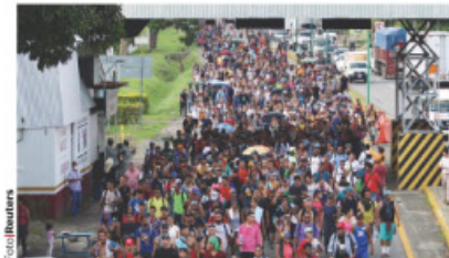
EL CONTINGENTE que salió ayer de Tapachula está formado por al menos dos mil personas.

DE ENERO a junio repuntan solicitudes a Comar 15%, respecto al mismo periodo de 2021; de Honduras y Cuba, los que más solicitan papeles aquí pág. 10