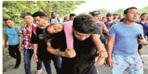
La novena caravana migrante salió ayer desde Tapachula. Son alrededor de cuatro mil personas con niños y mujeres embarazadas.

Aunque en muchos casos se desconoce la causa de muerte o desaparición, se contabilizan 31 ahogados y 80 decesos relacionados con accidentes, incluidos los