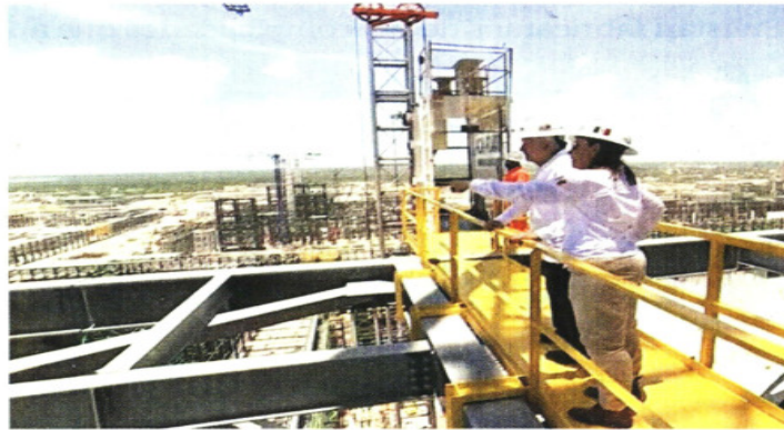
El Presidente López Obrador hizo un recorrido por las instalaciones de la refinería.