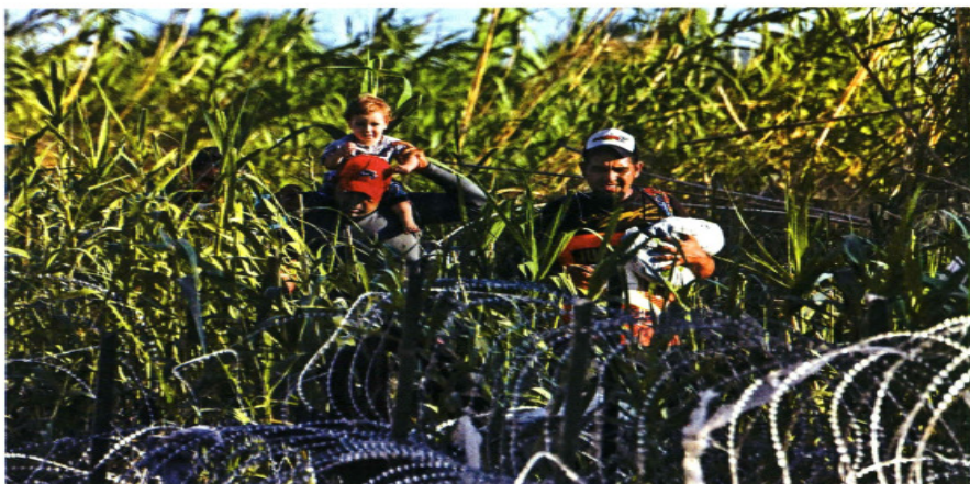
Una familia migrante de Venezuela camina junto a una alambrada en Eagle Pass, Texas, tras cruzar el río Bravo.