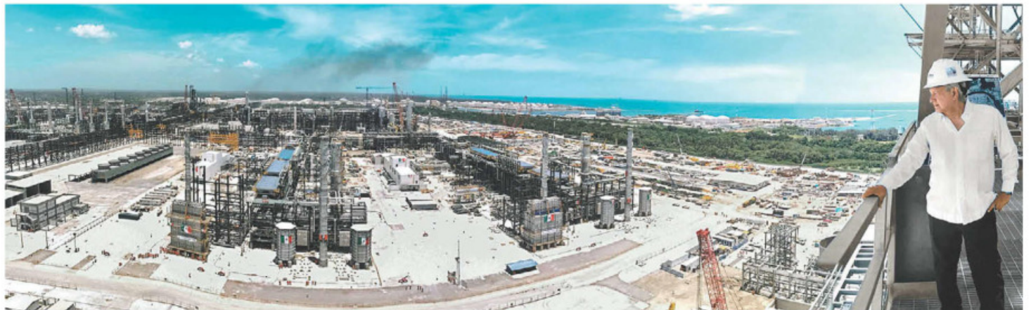
El Presidente subió a una torre de la planta de Pemex en Tabasco para supervisar los avances.

Laberinto: Arquitectas mexicanas postulan el nuevo urbanismo