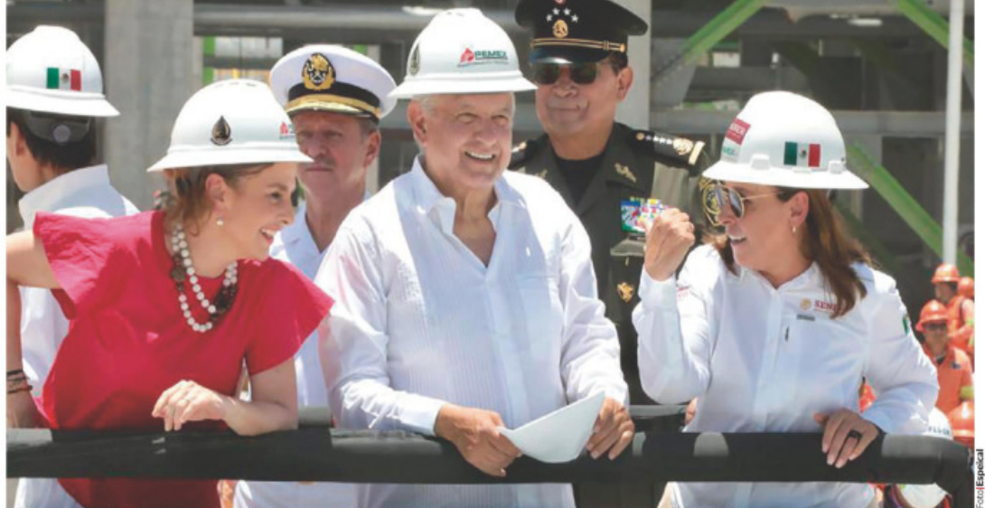
EL PRESIDENTE acompañado de su esposa Beatriz Gutiérrez (izq.) y la secretaria de Energía, Rocío Nahle, ayer, en Paraíso, Tabasco.

◉ SUPLEMENTO DE LA RAZÓN EN PÁGINAS CENTRALES