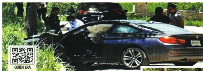
El vehículo del empresario quedó estrellado contra un árbol.

Tunesi era propietario del Hotel Quinta Chanabnal,