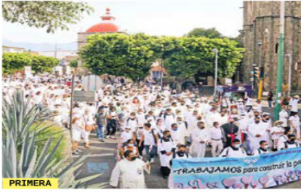
PRIMERA No más demagogia, claman en caminata

"No entrará en el orden de la profanación o del robo, pues ya están