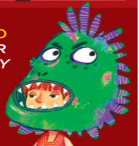
Ilustración: Jesús Sánchez

La historia de una acosadora escolar que cambia de actitud gracias a una amiga llevó a Ricardo Zárate a ganar el premio Gran Angular. / 22