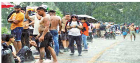
Pese al mal clima registrado en días recientes, la novena caravana que salió de Tapachula continúa su camino rumbo al norte del país.

Incluso, se ha detectado que algunos migrantes