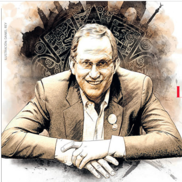
ILUSTRACIÓN: DANIEL REY

Ante el encarecimiento, el estribillo de la popular canción de Daddy Yankee es una especie de himno en las recientes protestas en la región. Pág. 22