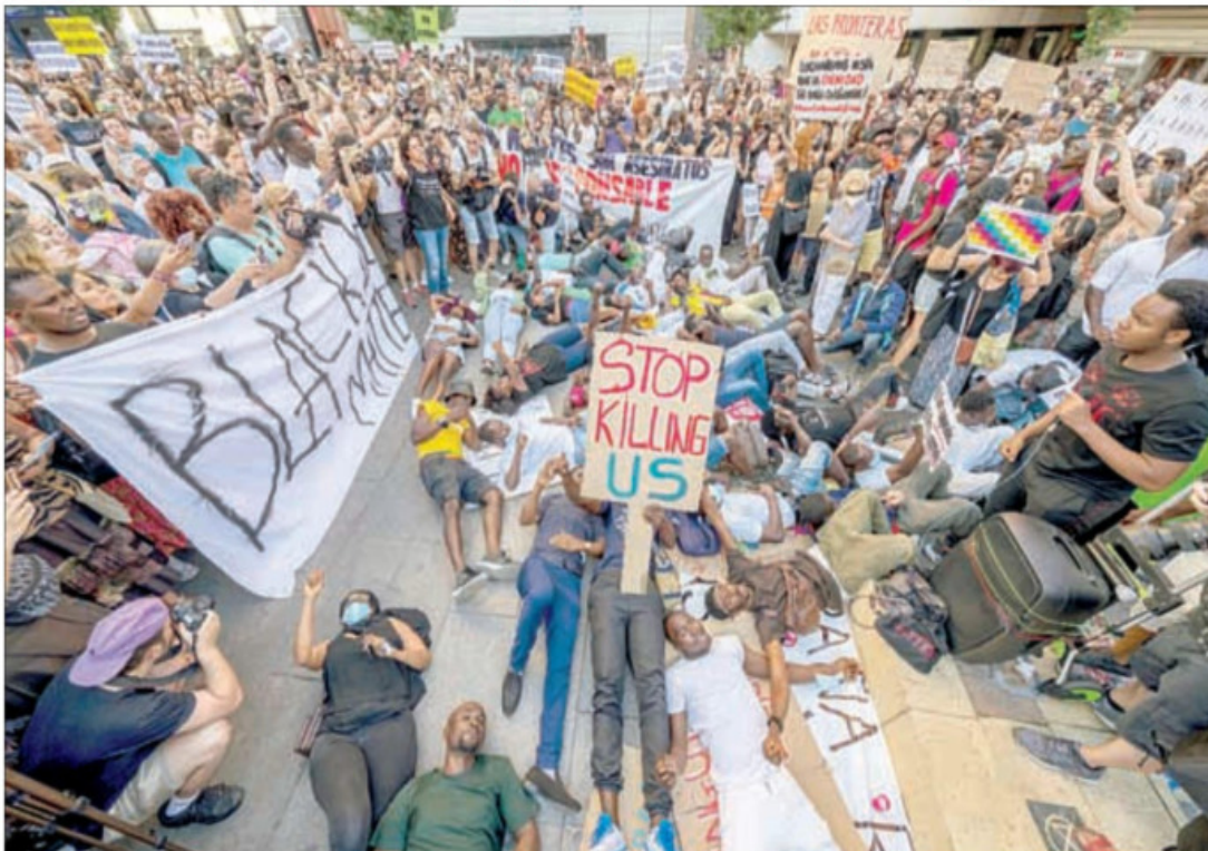
▲ Tras la convocatoria de 37 ONG, miles de personas se concentraron durante dos días en más de 60 ciudades de España para exigir que se ponga fin a la masacre de migrantes subsaharianos en la frontera en Ceuta y Melilla, donde el pasado 24 de junio ocurrió la peor