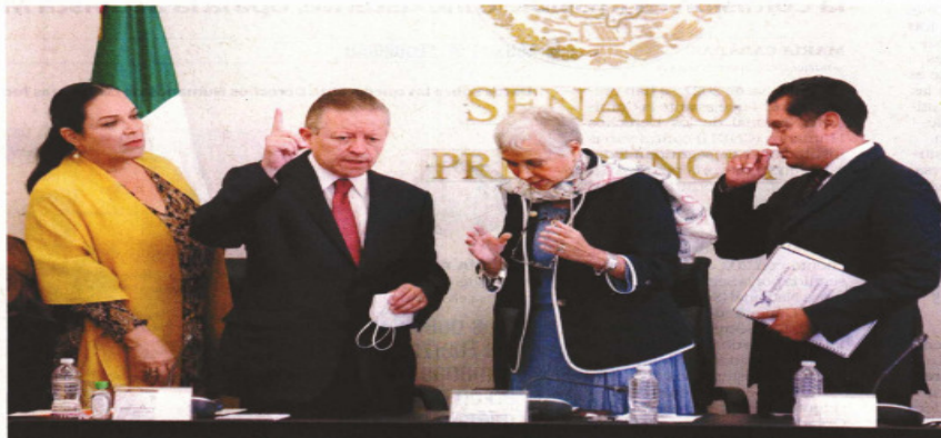
El ministro presidente de la Corte, Arturo Zaldívar, presentó la iniciativa ante la Comisión Permanente del Congreso de la Unión, que encabezaron la senadora Olga Sánchez Cordero y el diputado Sergio Gutiérrez Luna.