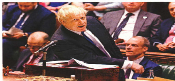
El primer ministro británico, Boris Johnson, durante un interrogatorio en la Cámara de los Comunes, ayer, en Londres.