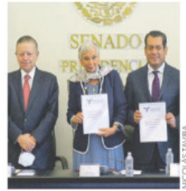
COMISIÓN PERMANENTE. Plantean erradicar la violencia feminicida.