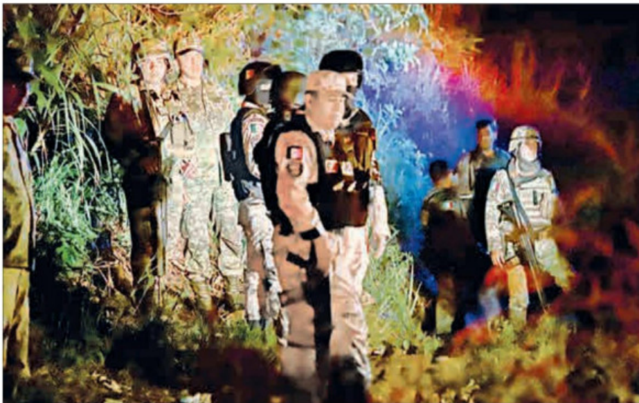
◀ El percance ocurrió la noche del martes en el tramo que va de Ocozacoautla, Chiapas, a Las Choapas, Veracruz. Los heridos, de Guatemala, El Salvador y Cuba, fueron llevados a Tuxtla Gutiérrez. Una migrante señaló que la unidad volcó porque el conductor intentó huir de la Guardia Nacional.

“Plantearé a Biden regularizar flujos de trabajadores; hay que poner alto a polleros”