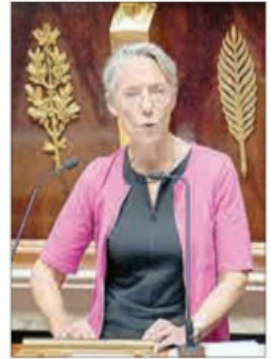
▲ La premier de Francia, Elisabeth Borne, hizo el anuncio de la nacionalización ante el Legislativo.