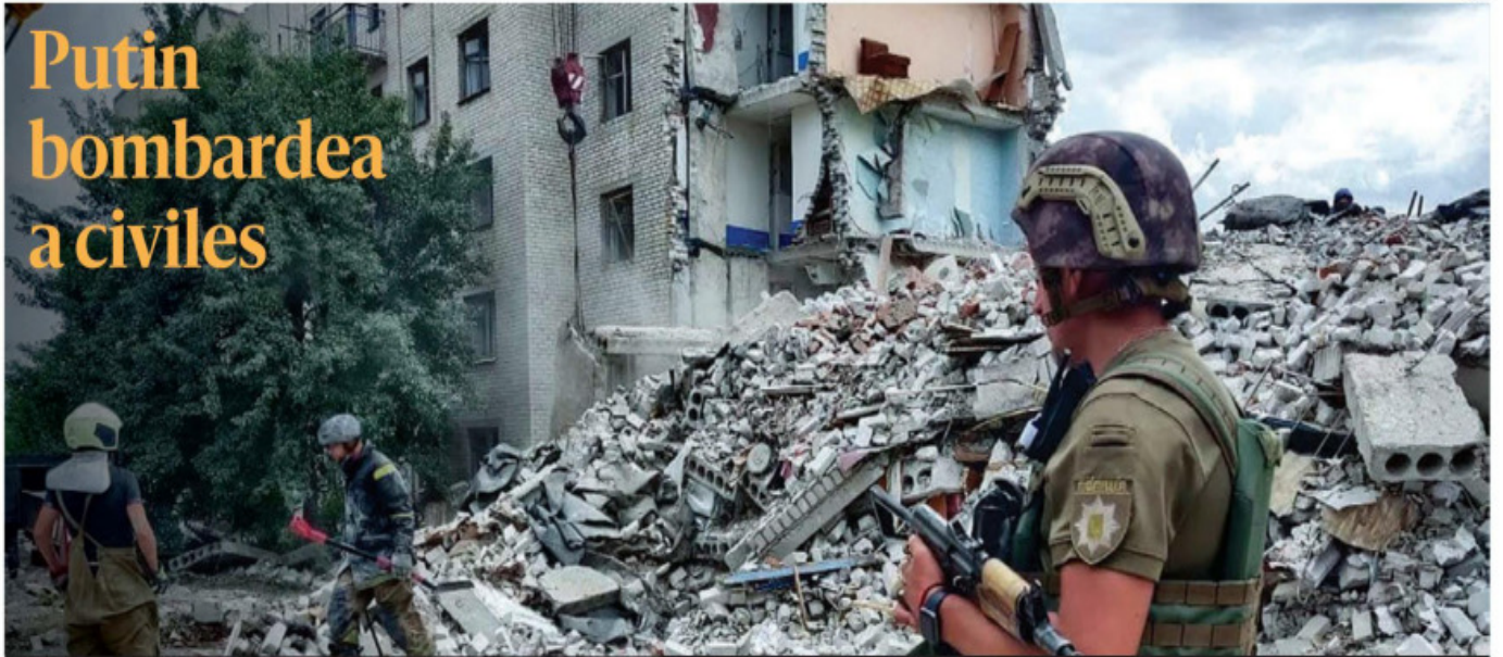
Rescatistas ucranianos retiran escombros de un edificio residencial bombardeado este domingo por las tropas rusas en Chasiv Yar, Ucrania. Al menos 15 personas murieron, dijeron los Servicios de Emergencia del Estado. PÁG 19