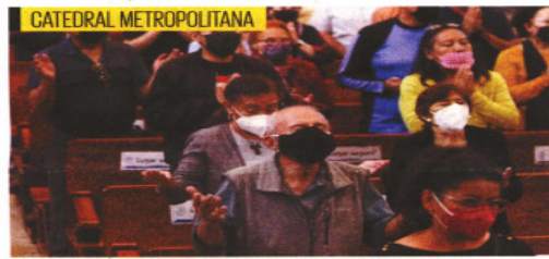
En la Catedral el obispo auxiliar precisó que para construir la paz se necesita de todos, pues no es tarea exclusiva de una sola persona.