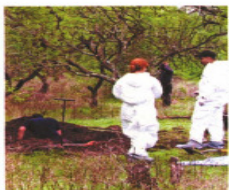
En el lugar podría haber hasta 500 cadáveres, aseguran.

Los Negritos, en Michoacán, pasó a ser conocido como el Corredor de la muerte