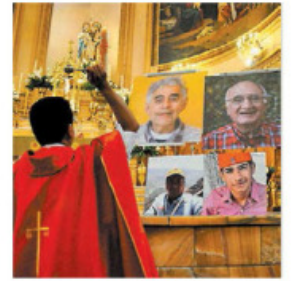
Jornada de oración. ESPECIAL

Obispos y curas insistieron en cambiar la estrategia de seguridad en la Jornada Nacional de Oración por la Paz. PÁGS. 8 A 11