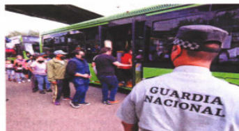
Elementos de la Guardia Nacional vigilarán el desempeño del servicio alterno.