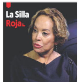
La Silla Roja.