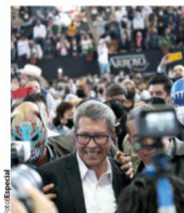
RICARDO MONREAL, ayer en la Plaza de Toros Arroyo.

• A RITMO de cumbia, rap y gritos de ¡presidente, presidente!, líder de la Jucopo en el Senado encabeza evento de "Reconciliación por México"; afirma que no se prestará a una farsa. pág. 9