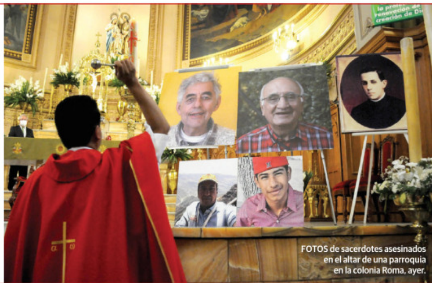
FOTOS de sacerdotes asesinados en el altar de una parroquia en la colonia Roma, ayer.

• En la Estela de luz rinden homenaje a jesuitas asesinados y víctimas del crimen; lasallistas ven barbarie; no hay resultados en plan de abrazos, no balazos, aseguran