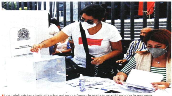
Los telefonistas sindicalizados votaron a favor de realizar un diálogo con la empresa.