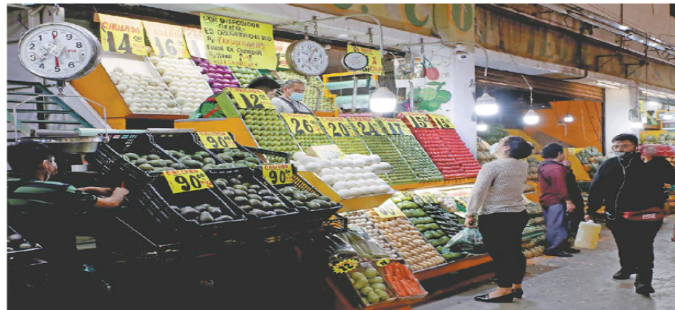
La naranja y el aguacate son los alimentos que han subido más de precio en la administración actual.

Carestía fue de 15% en el gobierno anterior, reporta el Inegi; alertan de enfermedades y población que no podrá comer tres veces al día