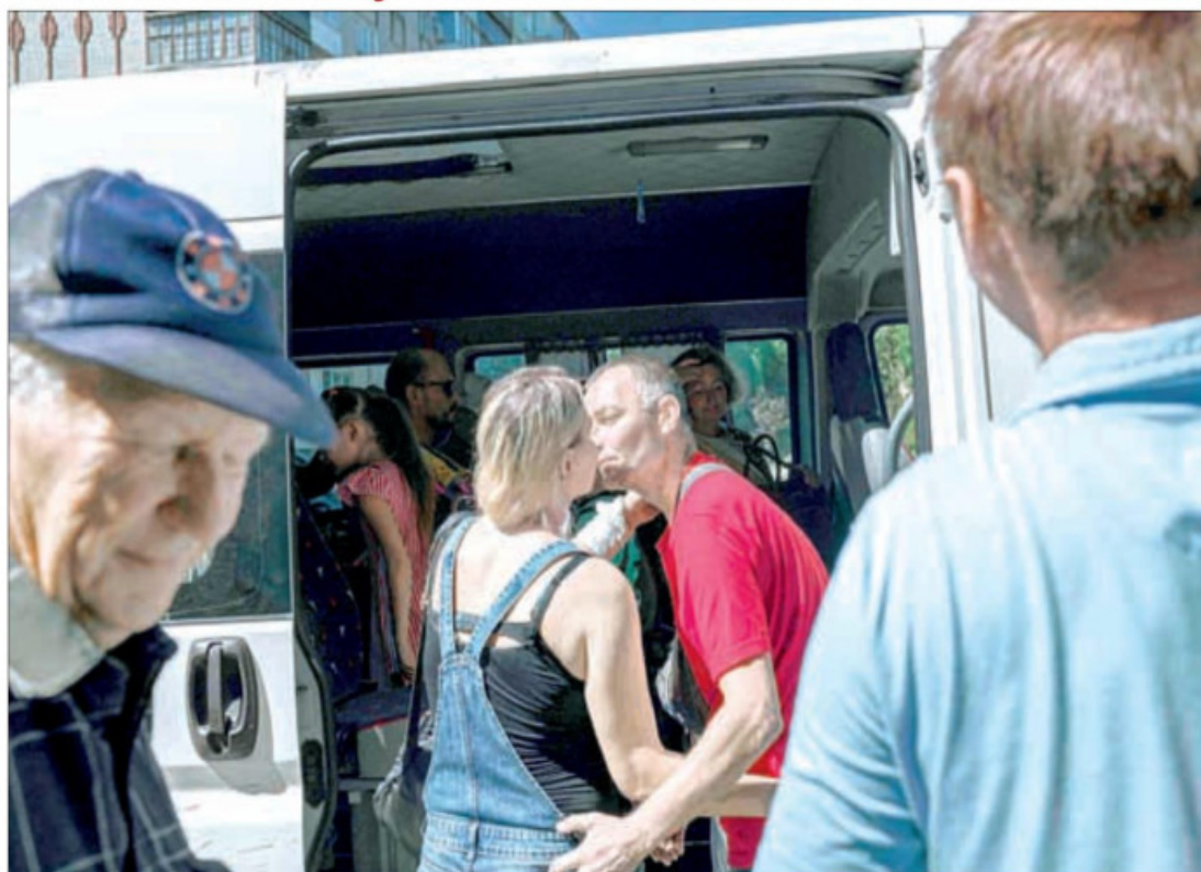
▲ El decreto que obliga a la población a salir de la región de Donetsk, la cual se halla en la primera línea de fuego desde el inicio del conflicto, se da un día después de que fue bombardeada la cárcel de prisioneros de guerra de Elenovka, con saldo de al menos 50 muertos.