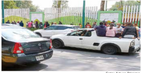
En el Deportivo Los Galeana, en la CDMX, el operativo de acarreo incluyó transportar a mujeres en la parte trasera de camionetas.