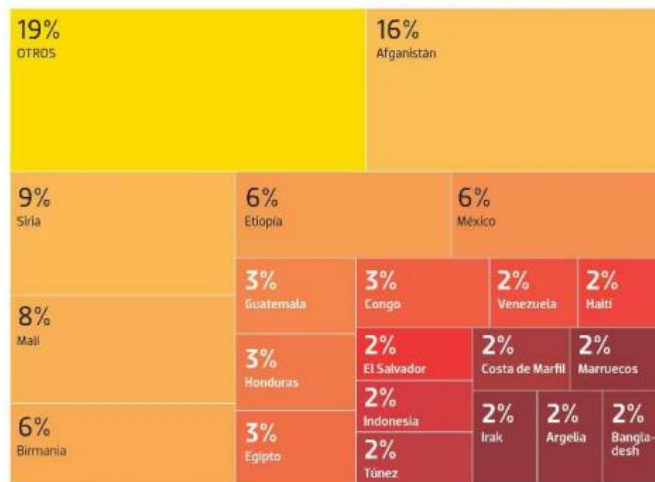
PARTICIPACIÓN PORCENTUAL DE LA NACIONALIDAD IDENTIFICADA (%)*

*El conteo no representa la totalidad de las muertes debido a un gran subregistro en la materia. Para los datos de nacionalidad sólo se consideraron los eventos en los que el origen de la víctima estuvo plenamente identificada.