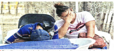
Familiares de los trabajadores atrapados, cerca de la mina.

Por la mañana, el Presidente López Obrador había calificado la jornada de ayer como decisiva. "Se sabrá si hay posibilidad de que entren sin riesgo los buzos", tuiteó. ASEDIAN A AMLO LAS EMERGENCIAS PÁGINA 6