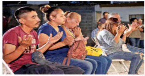
La tarde de ayer se ofició una misa en la comunidad para pedir por el rescate; antes, se rezó un rosario cerca del pozo inundado.