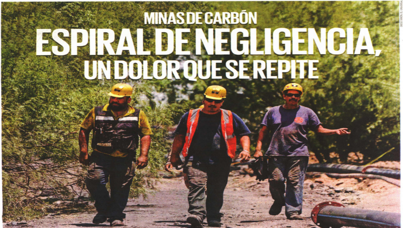
Rescatistas siguen la búsqueda de los mineros atrapados en un pozo de carbón en la comunidad de Villa de Agujita, municipio de Sabinas, Coahuila.