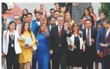
EBRARD con diputados de Morena, ayer.

• Presidente asegura que hubo consulta para nuevo modelo y no se afectará a maestros ni a alumnos; el lunes inicia el ciclo escolar 2022-2023 en educación básica