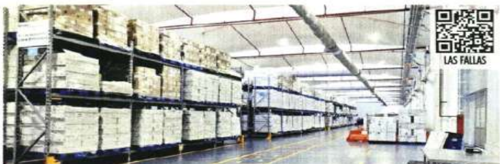
Foto tomada en diciembre pasado de las medicinas en bodegas de Birmex. Fuentes reportan que los fármacos siguen ahí.