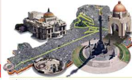
GRÁFICO: ALEJANDRO OYERVIDES