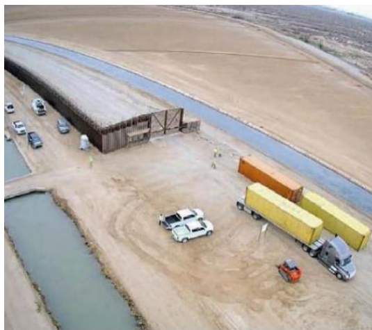
Los trabajos iniciaron la mañana de ayer

Ponen contenedores para frenar migrantes