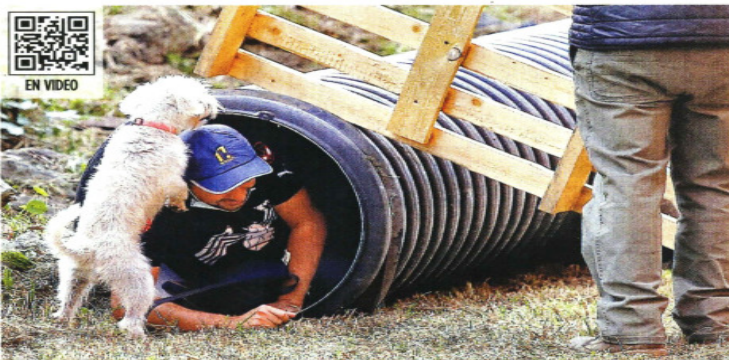
En el taller, realizado en la Alcaldía Tlalpan, participaron 35 binomios can y humano.