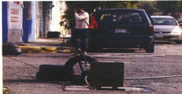
En la red hidráulica se han detectado tomas clandestinas en las que se instalan mangueras y bombas para llevar el agua a puntos de almacenaje.