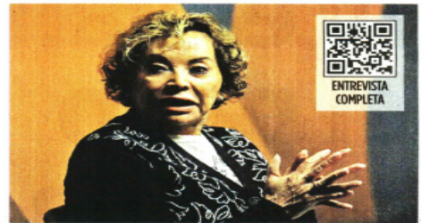
Elba Esther Gordillo cuestiona la política educativa de la 4T.

“Los pasajeros potencian los mexicanos o americanos, desde México a Estados Unidos y viceversa”, expresó, “están teniendo una mayor oferta de alternativas y de tarifas de las líneas aéreas norteamericanas, incluidas las de bajo costo que están avanzando a pasos agigantados”.