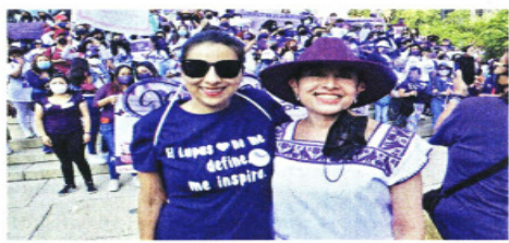
Cada año, personas con lupus y familiares marchan en CDMX.