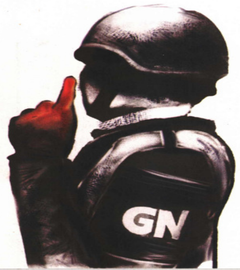
ILUSTRACIÓN: DANTE DE LA VEGA, EL UNIVERSAL

La corporación en la que están cifradas las esperanzas del país para acabar con la violencia y la inseguridad tiene mil 303 denuncias en contra por diversos delitos, sin que haya procedido ni una sola. Especialistas afirman que trasladar su mando a la Secretaría de la Defensa Nacional la blindará bajo el fuero militar ante cualquier acusación. Recién trasladada al Ejército, la GN capacitará a 12 de sus agentes en análisis político, a fin de que comprendan sobre estos procesos, así como de temas electorales. | NACIÓN | A6 Y A7