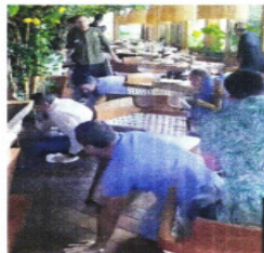
OTRA VEZ PÁNICO. El funcionario fue asesinado en la segunda balacera en 20 días en la zona metropolitana de Guadalajara.

"(Llamas) estaba acompañado por un par de sujetos; uno de los sujetos de manera repentina le hace los disparos de manera directa. Se desata-