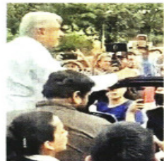
Estudiantes en Chilapa cerraron el paso al Presidente.

En Tlalpan, en la CD-MX, alumnos se quedaron esperando a Sosa, quien hace una semana les prometió una reunión para revisar su solicitud también de un edificio.