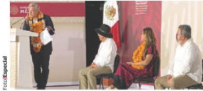
EL PRESIDENTE, el jefe del INPI, la gobernadora y el titular de la SICT, ayer.