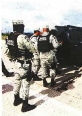
Agentes de la Guardia Nacional logran controlar cada vez a más migrantes.

El número de elementos del Ejército y de la Guardia Nacional desplegados en la frontera sur del país se incrementó a 31 mil 607 en el último mes.