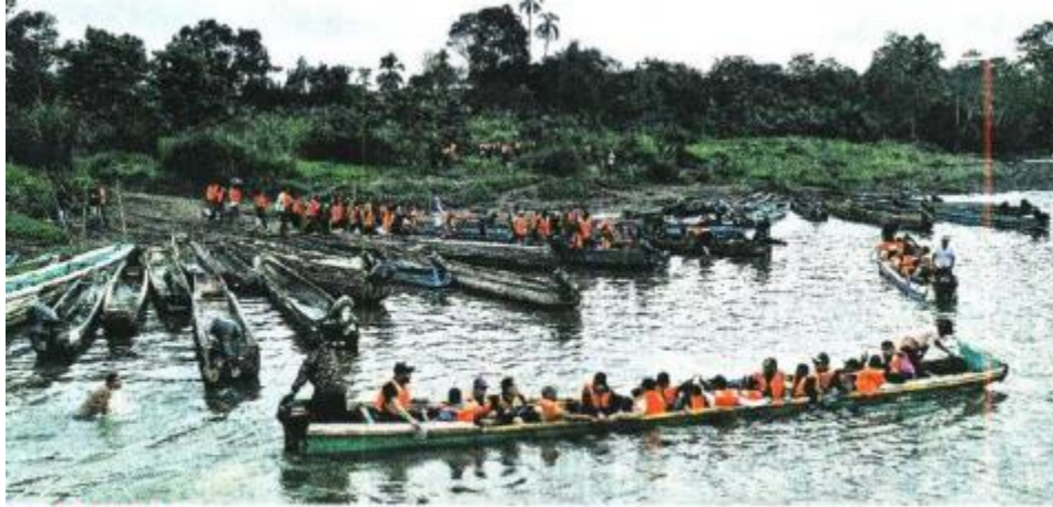
PELIGROSO. Migrantes se suben en botes para ser transportados desde el pueblo de Canaan Membrillo hasta la Estación de Recepción de Migrantes en Meteti, provincia de Darién, Panamá.