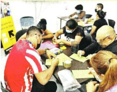
Personas solicitantes de refugio

México es el tercer país con el mayor número de solicitantes de condición de refugiado a nivel mundial.