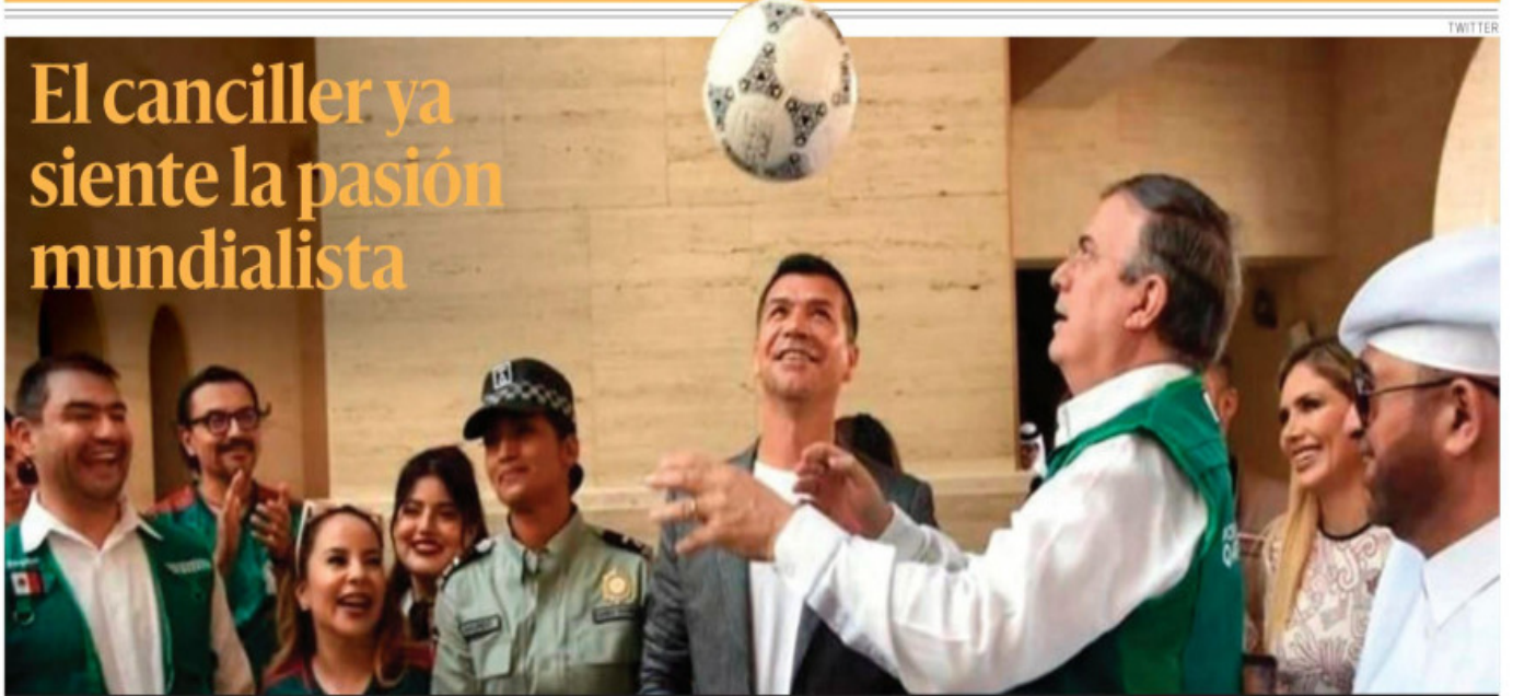
El secretario de Relaciones Exteriores, Marcelo Ebrard aprovechó su estancia en Qatar, sede de la Copa del Mundo de la FIFA que inicia este domingo, para realizar algunas dominadas de balón, al inaugurar el Centro México en el país árabe; lo acompaña el exfutbolista, Jared Borgetti. PAG 7