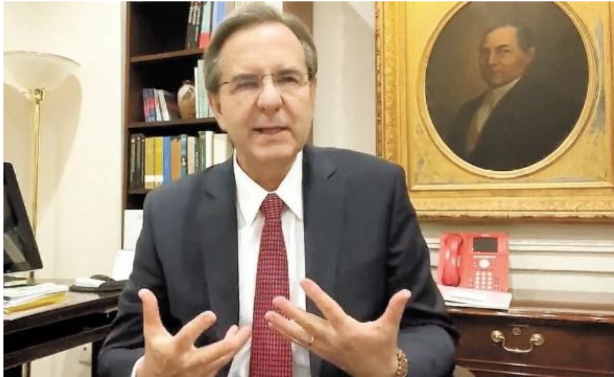
Entrevista a Esteban Moctezuma, embajador de México en EU

Pocas horas antes de las elecciones intermedias de ayer, el embajador de México en Estados Unidos, Esteban Moctezuma Barragán, comenta sobre las posibles implicaciones que tendría para México una victoria del Partido Republicano: los temas que afectaría irían desde programas para inmigrantes hasta temas de derechos humanos. El embajador enfatiza sobre el intenso diálogo que existe entre Estados Unidos y México.