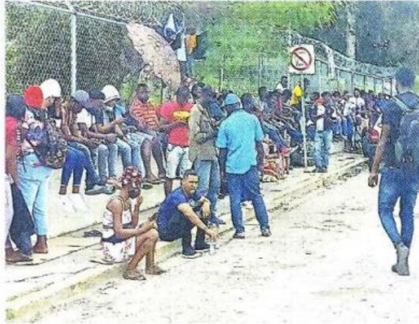
La sentencia emitida el pasado martes impide bloquear el ingreso de migrantes a EU.

Un juez estadounidense concedió cinco semanas al Gobierno de Joe Biden para cumplir la sentencia que impide aplicar una norma de salud pública para bloquear la entrada de personas migrantes que solicitan asilo en la frontera con México.