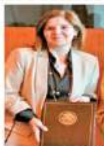
Pilar Canceña Rodríguez, secretaria de Estado de Asuntos Exteriores español.

En el primer viaje oficial de la SDCI a México, la funcionaria conoció distintos