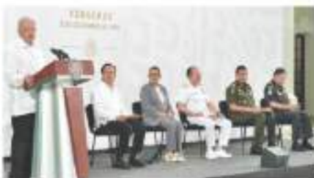
AMLO, el gobernador de Veracruz y los titulares de SSP, Marina y Defensa, y Jefe de la GN, ayer.

• Woldenberg , ex presidente del IFE, lamenta que Ejecutivo ataque instituciones que lo llevaron al poder; Odiara rechaza elegir magistrados por voto popular pág. 6