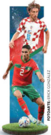
FOTOMATE ERICK GONZÁLEZ