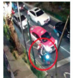
Agresores captados por el CS.

Condena. El periodista Ciro Gómez Leyva fue blanco de un ataque directo por dos sicarios en motocicleta que la noche del jueves dispararon contra el comunicador, que salvó la vida gracias al blindaje de su camioneta. La policía capitalina dispondrá de todas sus capacidades para detener a los responsables, en tanto, el gremio periodístico, político y social expresaron su solidaridad con el comunicador. PAGS