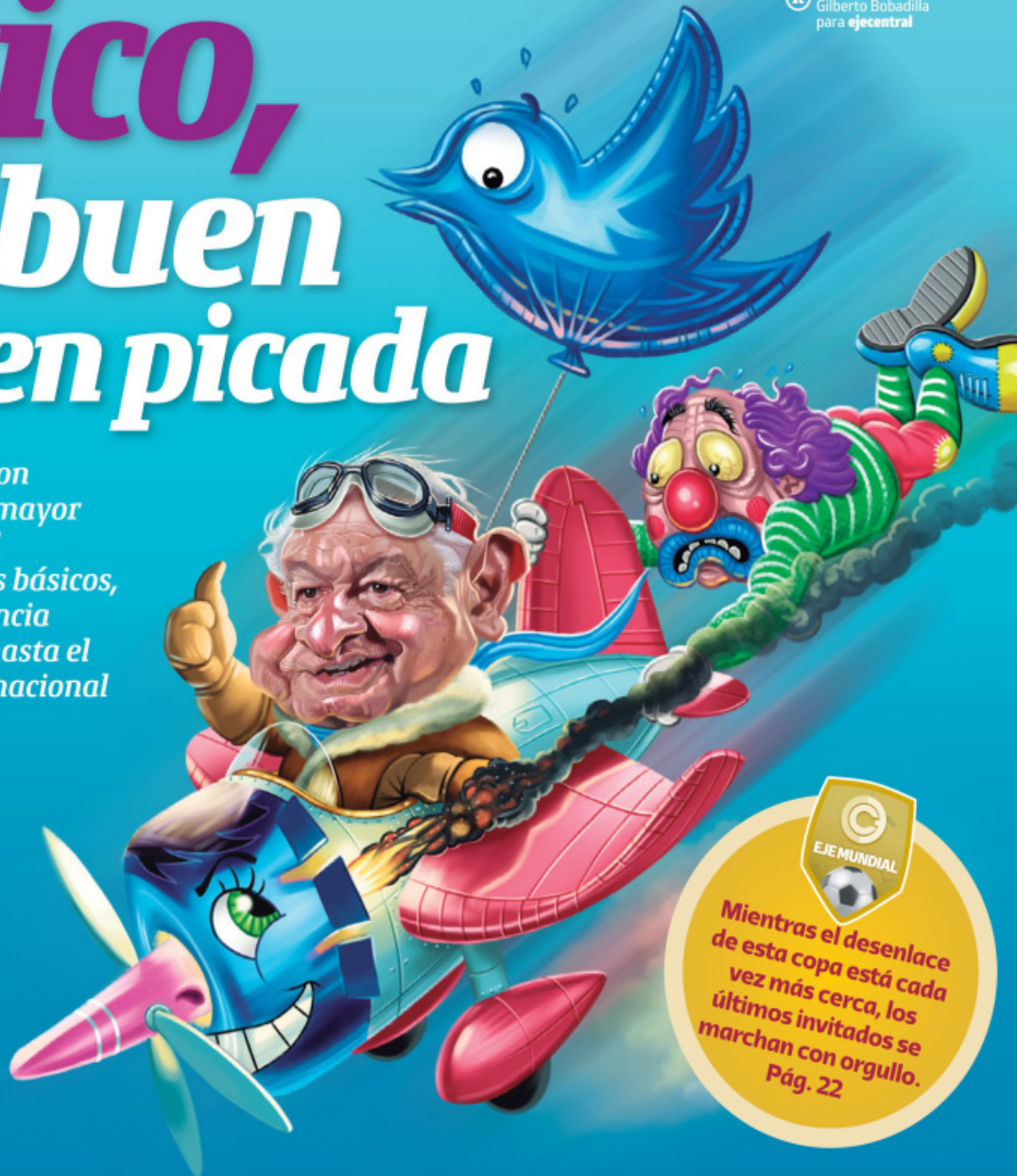
Ilustración: Gilberto Bobadilla para eje central

El consumo de las micheladas se adueñó de los tianguis, donde la creatividad ha llevado esta bebida a otro nivel. Pág. 20