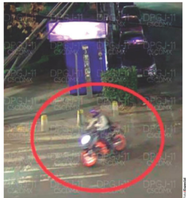
UNO de los atacantes al momento de huir, grabado por cámaras del C5.

GOBIERNO ibérico reprueba "tajantemente" dichos del mexicano; los califica de "incomprensibles", tras éxito de reunión binacional pág. 3