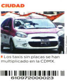
Los taxis sin placas se han multiplicado en la CDMX.