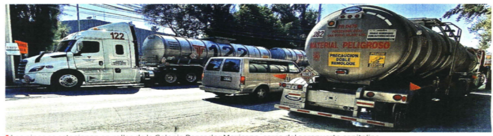
Las pipas se estacionan en calles de la Colonia Pensador Mexicano, cerca del aeropuerto capitalino.