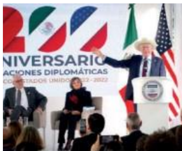
EL EMBAJADOR de EU, Ken Salazar (der.), ayer, durante la alianza USAID.

El gobierno de Estados Unidos invertirá 24 mil millones de dólares en cinco capitales mexicanas, Ciudad de México; Hermosillo, Sonora; Monterrey, Nuevo León; Guadalajara, Jalisco, y Mérida, Yucatán, para ayudarlas a implementar acciones contra el cambio climático.