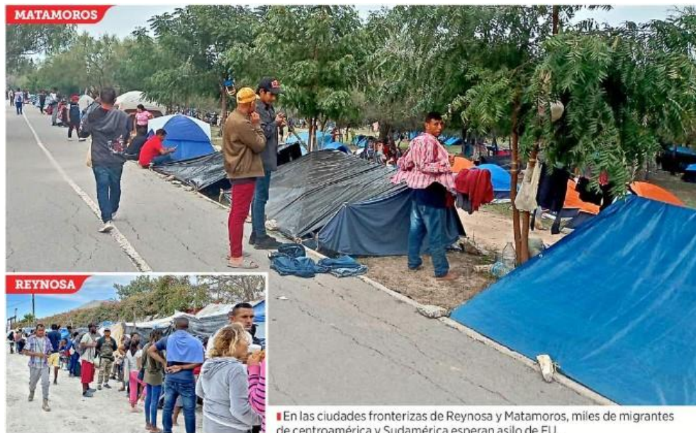
■ En las ciudades fronterizas de Reynosa y Matamoros, miles de migrantes de centroamérica y Sudamérica esperan asilo de EU.

Matamoros. - Las principales ciudades fronterizas de Tamaulipas están desbordadas por al menos 14 mil migrantes que buscan asilo en Estados Unidos, pero las autoridades esperan el arribo de hasta 17 mil más en las próximas semanas o meses.