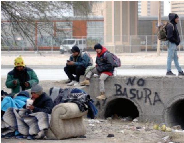
MIGRANTES centroamericanos en la frontera de Ciudad Juárez, Chihuahua, ayer.