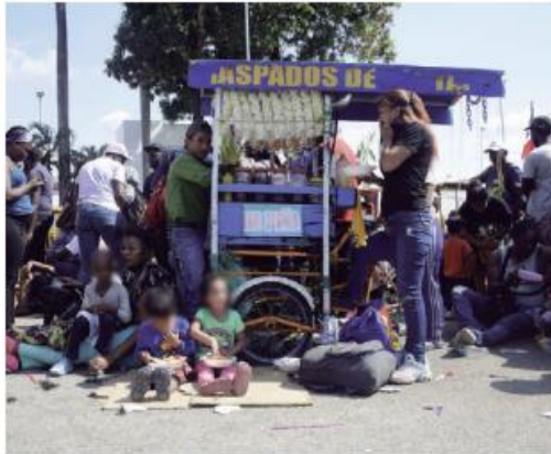
MIGRANTES descansan en la Estación Migratoria Siglo XXI, el 29 de diciembre.