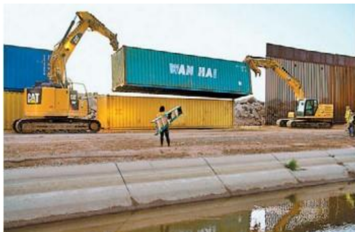
Maquinaria retira las unidades que bloqueaban el paso.