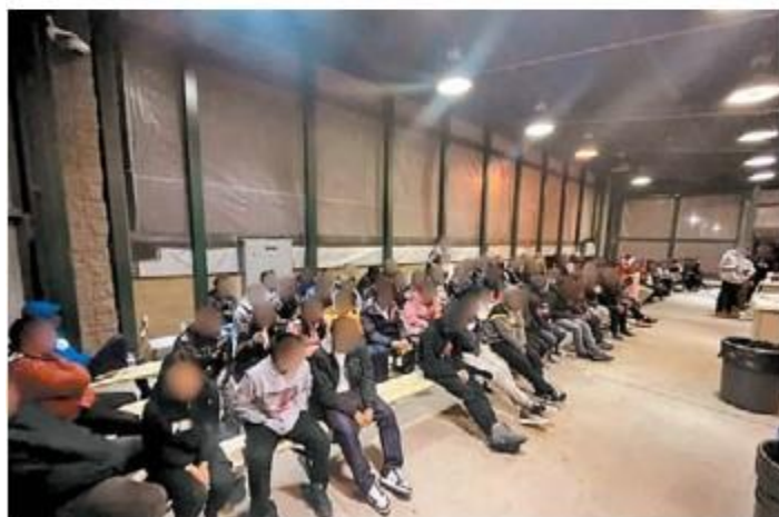
Migrantes detenidos por la Patrulla Fronteriza.

En los primeros días de este 2023, la Patrulla Fronteriza de Estados Unidos detuvo tres contingentes de migrantes en las inmediaciones de Lukeville, Arizona, frontera con Sonoyta, Sonora.