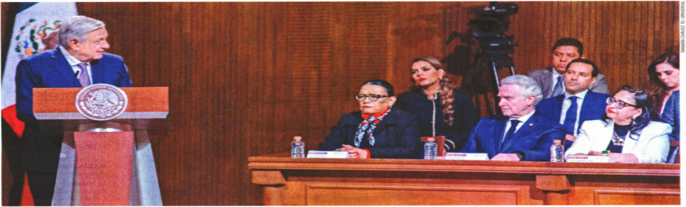
El presidente Andrés Manuel López Obrador ayer en su participación en la ceremonia; lo escuchan, entre otros, Santiago Creel y Norma Piña.