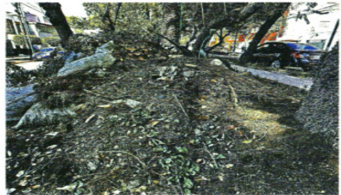
Estado de una de las obras modificadas por la Alcaldía.

La Sedena también apuesta por 15 camionetas SUV con blindaje Nivel V Plus, el cual soporta ataques con fusiles de asalto calibre 7.62, por un costo de entre 50 y 55 millones de pesos.