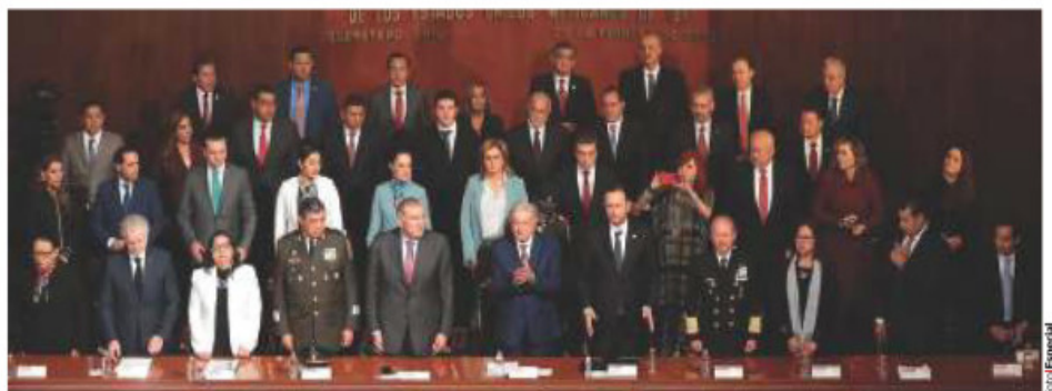
EL PRESIDENTE, los representantes de los poderes Judicial y Legislativo y los gobernadores del país, ayer, en Querétaro.

"EL HUMANISMO mexicano expresado por el Ejecutivo es un concepto válido, sustentado en la razón jurídica y en la esencia de estas modificaciones (constitucionales) que hemos hecho a favor de los mexicanos" Alejandro Armenta Presidente del Senado de la República