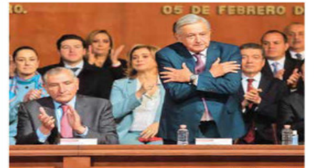
El presidente Andrés Manuel López Obrador encabezó la ceremonia por el 106 aniversario de la Constitución, en Querétaro.