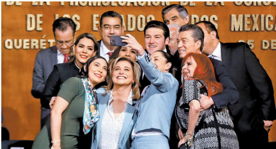
Claudia Sheinbaum organizó la selfi entre gobernadores asistentes a la ceremonia.