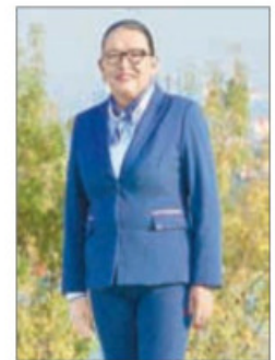
La secretaria de Seguridad Pública Ciudadana, durante la entrevista con La Jornada.

Rosa Icela Rodríguez: “no me he olvidado de la CDMX”