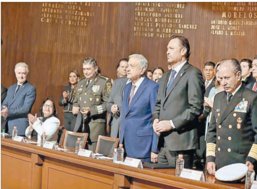
▲ Durante la ceremonia por el 106 aniversario de la Constitución en el emblemático Teatro de la República, en Querétaro, la ministra presidenta del máximo tribunal del país rompió los protocolos del