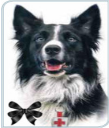
ATHOS (PAPÁ) ENVENENADO EN 2021 Participó en las labores de rescate tras el sismo del 19 de septiembre de 2017 en la CDMX.

Orly y Balam son dos canes rescatistas de la Cruz Roja Mexicana enviados a Turquía para continuar con la misión de su padre, Athos, otro perro de la institución que murió envenenado en junio de 2021. Ayer, Balam ayudó a sacar de los escombros a una persona de entre 35 y 40 años. Junto con su hermano (abajo) ha recuperado 11 cuerpos en la ciudad de Adiyaman. / 20