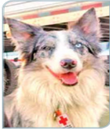
BALAM (HIJO) ESTÁ ACTIVO Junto con su hermano ha rescatado a tres personas con vida y ha recuperado 11 cadáveres.