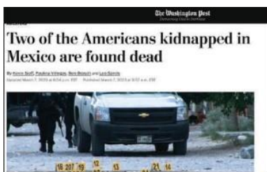
Así cubrió la noticia The Washington Post.