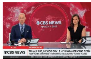
LA CBS emitió una alerta para dar a conocer el reporte.

La programación de los noticieros estadounidenses fue interrumpida cuando el breaking news tiñó de rojo las pantallas y en redes y portales la noticia se convirtió en la principal: dos de los cuatro viajeros secuestrados al cruzar la frontera hacia México fueron hallados sin vida.