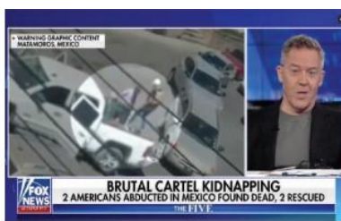
FOX NEWS dio una amplia cobertura a la información.