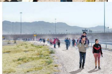
Decenas caminan a la frontera con Texas.