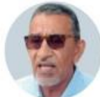
Tonatiuh Guillén López Extitular del INM

ESE LUGAR se convirtió en una cárcel, pues hasta antes del 2018 no había rejas y después las colocaron. Ahora tenemos el problema que (podrían llegar) hasta 30 mil o más"