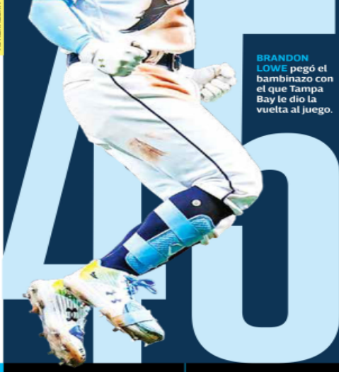
BRANDON LOWE pegó el bambinazo con el que Tampa Bay le dio la vuelta al juego.