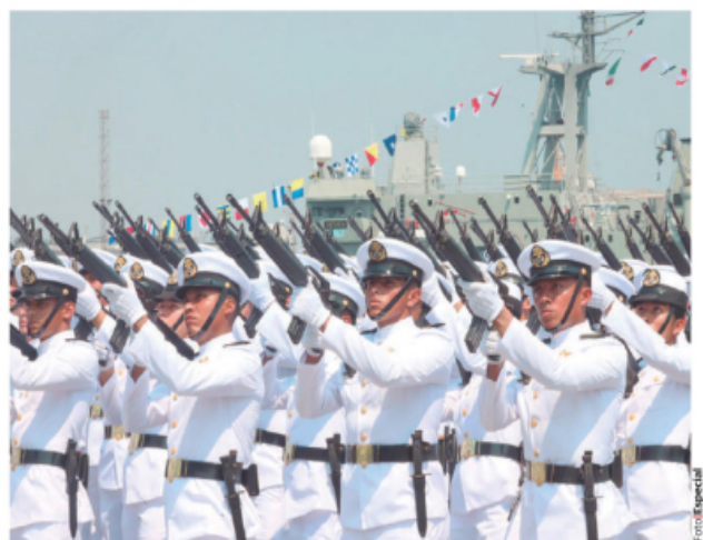
MARINOS, ayer en la conmemoración del 109 aniversario de la defensa de Veracruz.

ASEGURA ante filtración de tensiones que se van a quedar "con las ganas de vernos divididos"; titular de Marina advierte: "A México se le respeta" pág. 3