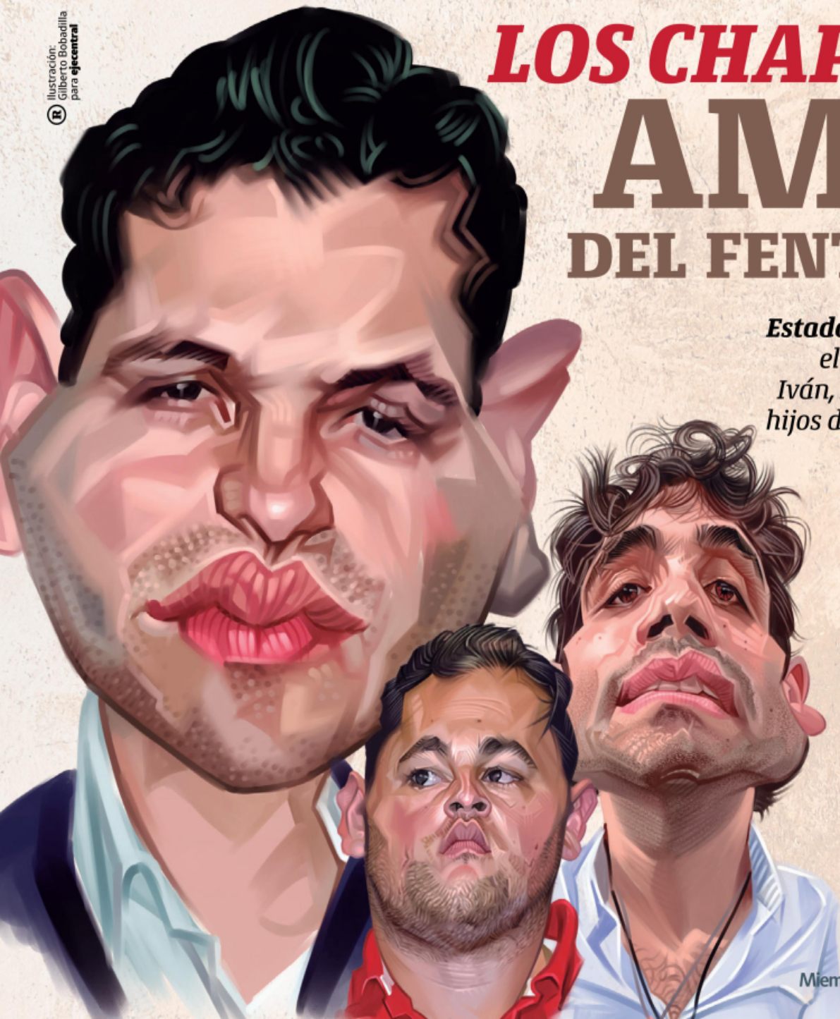
Ilustración: Gilberto Bobadilla para eje central

No. 345 · Año 7 · Viernes 21 al domingo 23 de abril. 2023