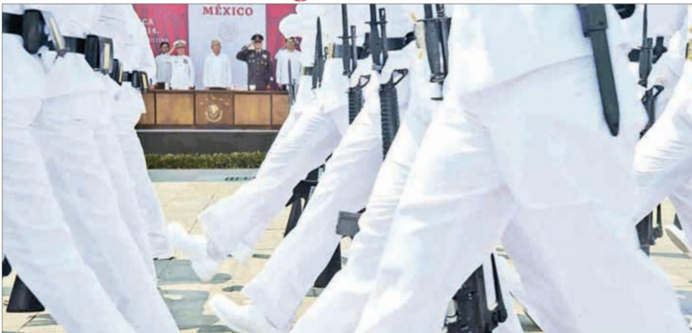
▲ López Obrador encabezó la ceremonia por los 109 años de la Defensa Patriótica del Puerto de Veracruz, invadido en 1914 por el ejército de Estados Unidos.