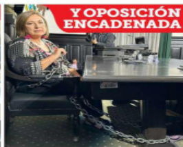
La senadora panista Xóchitl Gálvez protestó en el pleno de la sede del Senado en Xicoténcatl.