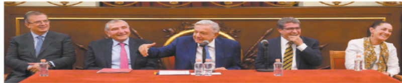
En medio de la crisis legislativa, el presidente Andrés Manuel López Obrador se reunió en Palacio Nacional con los senadores de Morena, encuentro al que también asistieron los aspirantes presidenciales Marcelo Ebrard, Adán Augusto López, Ricardo Monreal y Claudia Sheinbaum.

Tras reunirse con AMLO y las corcholatas , los senadores de Morena sesionan sin la oposición en Xicoténcatl