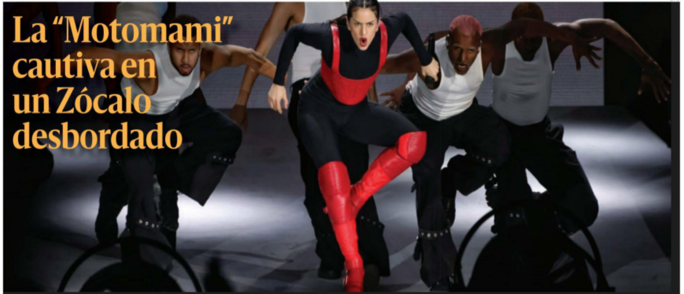
Aproximadamente 160 mil personas acudieron la noche de ayer al Zócalo capitalino para disfrutar del concierto gratuito que ofreció Rosalía, quien cerró en la CDMX su Motomami World Tour; autoridades reportaron saldo blanco. PAG 10