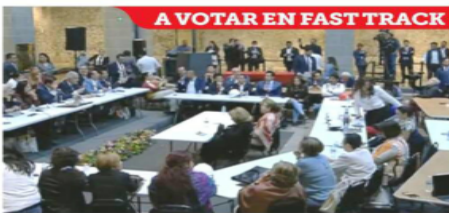
Tras su encuentro con AMLO, Senadores de Morena, PT, PVEM y PES sesionaron en una sede alterna para aprobar esta madrugada los pendientes de la agenda presidencial.