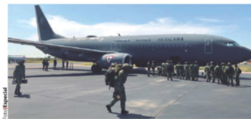
ARRIBO de militares, ayer a Tamaulipas.