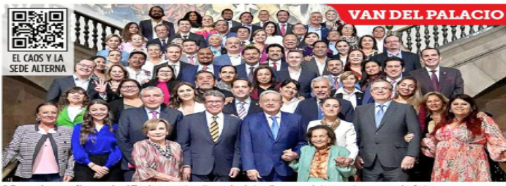
Senadores afines a la 4T y las cuatro "corcholatas" morenistas se tomaron la foto con el Presidente después de su reunión en Palacio Nacional.

"Les dijo que ellos serán, formalmente, los cuatro aspirantes que buscarán la candidatura. Comentó que en tres meses podrían darse los primeros pasos para una definición", agregó.