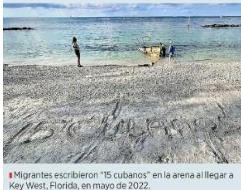
■ Migrantes escribieron "15 cubanos" en la arena al llegar a Key West, Florida, en mayo de 2022.

Tallahassee.- Dirigida por el Gobernador Ron DeSantis, un republicano con ambiciones presidenciales, la Legislatura de Florida está considerando un amplio paquete de medidas de migración que representarían la represión más dura contra la migración ilegal por parte de cualquier estado en más de una década.