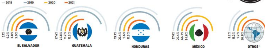
NÚMERO DE ENCUENTROS DE LA PATRULLA FRONTERIZA DE LOS EU POR NACIONALIDAD DEL MIGRANTE (%)