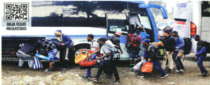
SE LOS LLEVAN. Decenas de migrantes, principalmente haitianos, fueron desalojados del albergue temporal que ocupaban en el bosque de Tláhuac tras el cierre intempestivo del refugio por las autoridades migratorias.

bierno federal, actualmente hay 26 mil 560 migrantes en la zona fronteriza norte del País, de los cuales 10 mil están en Ciudad Juárez, 7 mil en Reynosa, 5 mil 500 en Matamoros, 3 mil en Tijuana, 360 en Nogales, 420 en Piedras Negras y 280 en Ciudad Acuña.