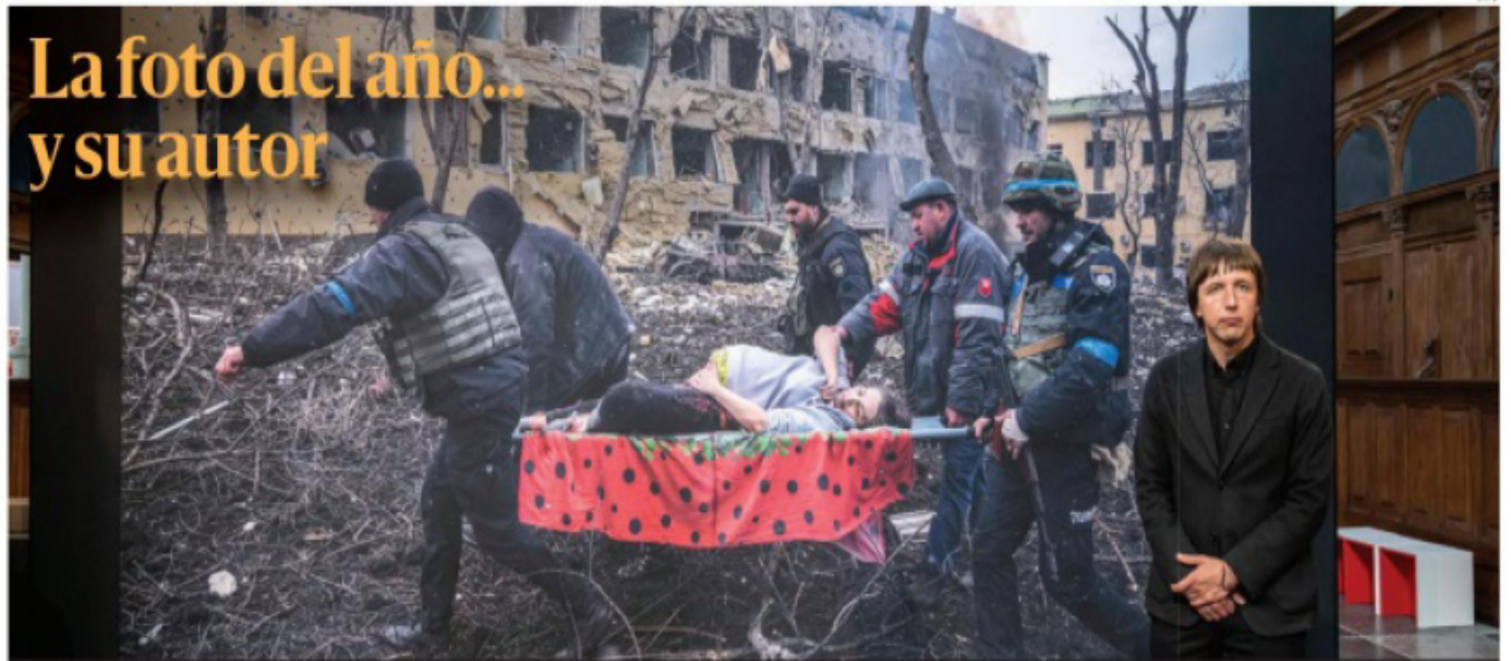
El fotógrafo ucraniano Evgeniy Maloletka gana el World Press Photo 2022, presea entregada por el príncipe holandés Constatijn, ayer en De Nieuwe Kerk en Ámsterdam. Maloletka captó a una mujer ucraniana embarazada que es rescatada de un hospital destruido por un bombardeo ruso.