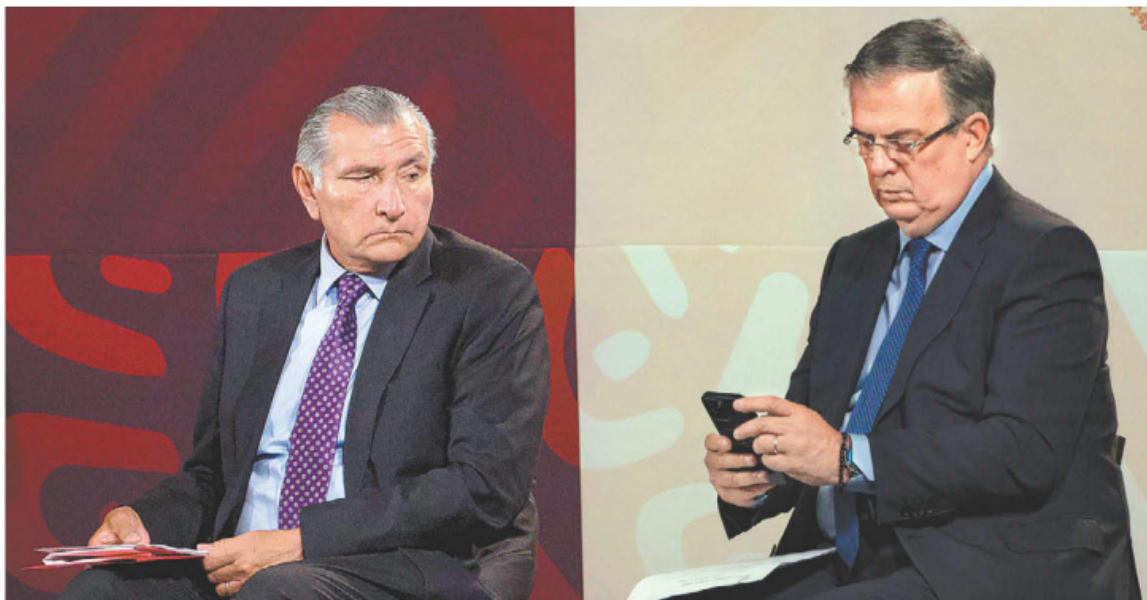
Los titulares de Gobernación y de Relaciones Exteriores en la conferencia de Palacio Nacional.