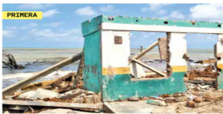
CENTLA, TABASCO