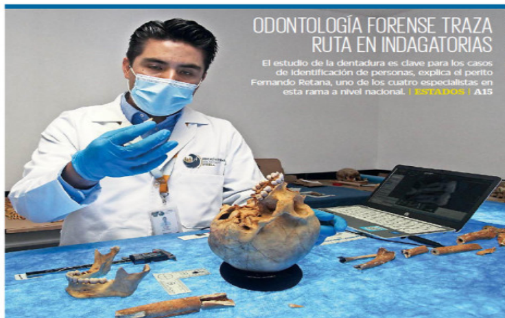
OMAR CONTRERAS EL UNIVERSAL