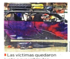
■ Las víctimas quedaron junto a sus vehículos.

aterrorizar, así como levantones y tablazos a taxistas que se niegan a pagar. En Michoacán paga piso toda la cadena de producción de limoneros, aguacateros y de carne de cerdo. Desde cortadores, empacadores hasta transportistas, advierten los afectados. En el Estado de México les cobran a transportistas, bares, comercios, taxistas, talleres mecánicos y tianguistas. "Para no ir más lejos, en el sector Bordo (de Xochiaca), los mandos extorsionan a los compañeros, le cobran piso por uso de patrullas o de cruceros para multar, así te lo digo", reveló un policía de Nezahualcóyotl. En Veracruz, como en muchos otros estados, las víctimas dicen que no denuncian las extorsiones por la colusión de los criminales con las autoridades. PÁGINA 13