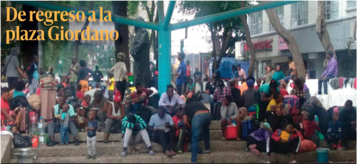
Luego de la fallida intentona para mover a los migrantes de la Pequeña Haití la madrugada de ayer, horas después un importante grupo regresó a la Plaza Giordano.