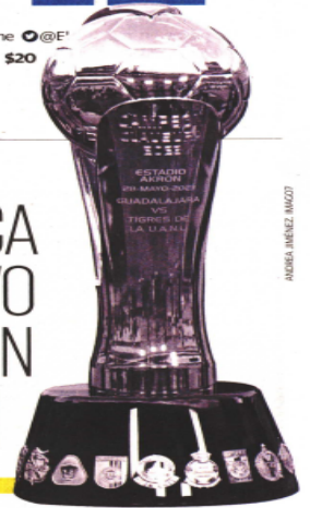
ROBERTO JIMÉNEZ / IMCOZ