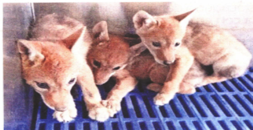
El tráfico de animales deja ganancias al crimen a la par de delitos como el contrabando de armas y drogas, afirman especialistas.