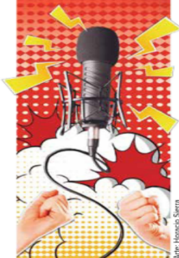
Autor: Horacio Sierra

Usar influencers para doblar la nueva cinta de Spider-Man es un tema de publicidad que no alegra a los actores de doblaje.