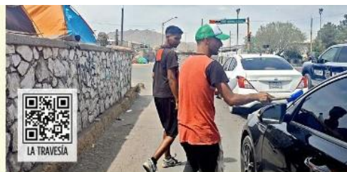
■ Ante la falta de recursos para mantener su estancia, los migrantes recurren a los cruceros para pedir dinero, limpiar vidrios o vender dulces.

Cd. Juárez.- Las calles de esta ciudad fronteriza se han convertido en una "pequeña Venezuela".