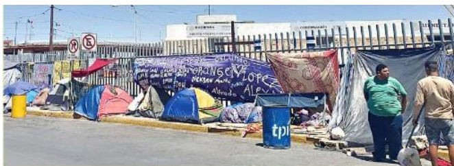
■ Al exterior de la estación del INM de Ciudad Juárez, donde murieron 40 migrantes en un incendio, fue instalado un campamento con 100 casas de campaña, habitadas principalmente por venezolanos.