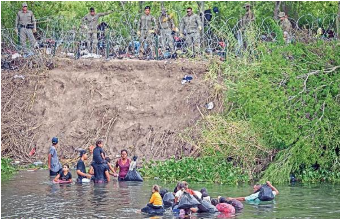
MARCAJE PERSONAL. Elementos de la Patrulla Fronteriza blindaron el río Bravo para evitar el paso masivo de migrantes por Tamaulipas. Los uniformados invitaban a hombres, mujeres y niños a regresar a México, porque el camino es muy peligroso en esa zona.