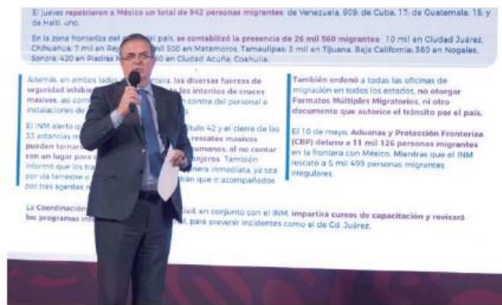
EL CANCELLER Marcelo Ebrard, en la conferencia mañanera de AMLO, ayer.

EN DÍA 1 tras fin del Título 42, el canciller destaca operativos "disuasivos" para evitar confrontaciones con indocumentados; muro amaneció blindado por la Patrulla Fronteriza