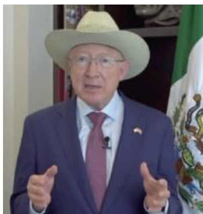
EL EMBAJADOR de Estados Unidos en México, Ken Salazar, en un videomensaje que compartió en redes sociales, ayer.

El embajador de Estados Unidos en México, Ken Salazar, recomendó a los migrantes que eviten convertirse en víctimas de traficantes de personas y mejor busquen los mecanismos de ingreso legal que se están negociando con diferentes países y que continuarán ampliándose.