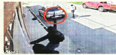
Uno de los agresores disparó con una pistola. La agresión se registró ayer en la tarde en la calle Del Nevado, delegación de San Mateo Oxtotitlán.

MONTSERRAT PEÑALOZA TOLUCA. Para incentivar hoy la participación ciudadana en las urnas, empresarios y locatarios adheridos a la Canaco en Edomex darán ofertas especiales. A la campaña "Neta que sí voy a votar", en el Valle de Toluca se registraron al menos 750 negocios, en los cuales con mostrar el dedo entintado, que confirma el haber votado, se dará café gratis o descuentos en comida. Mientras anoche morenistas denunciaron que al menos ocho sujetos encapuchados, armados con palos y una