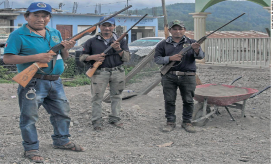
LENY MOSES / EL UNIVERSAL