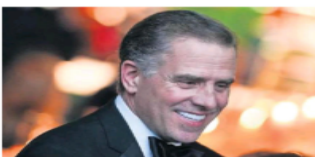
STEFANI BENVENUTO / AFP